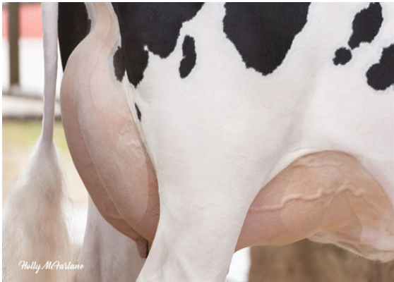
COOKIECUTTER A HOMILY DAM