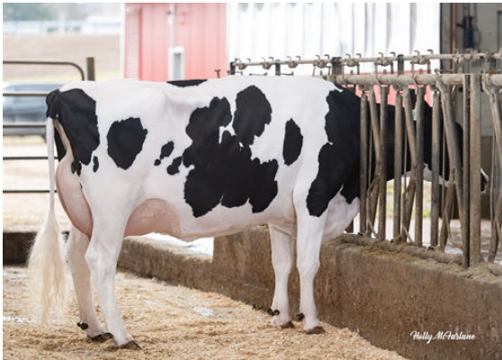
COOKIECUTTER A HOMILY DAM